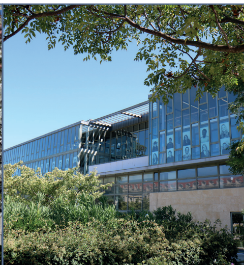
↑ Campus Hannah Arendt, bibliothèque universitaire Maurice Agulhon