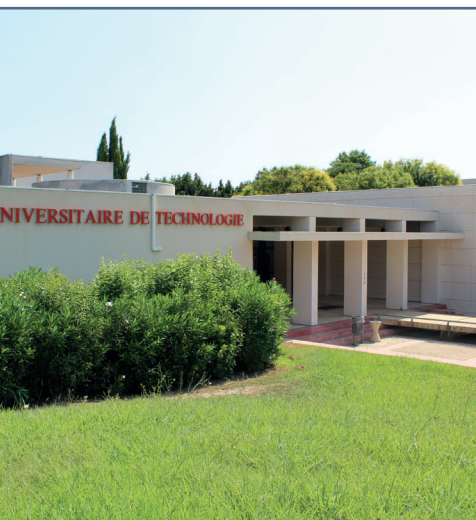
↑ Campus Jean-Henri Fabre, Institut Universitaire de Technologie