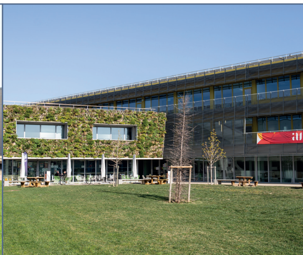
↑ Campus Jean-Henri Fabre, UFR Sciences, Technologies, Santé