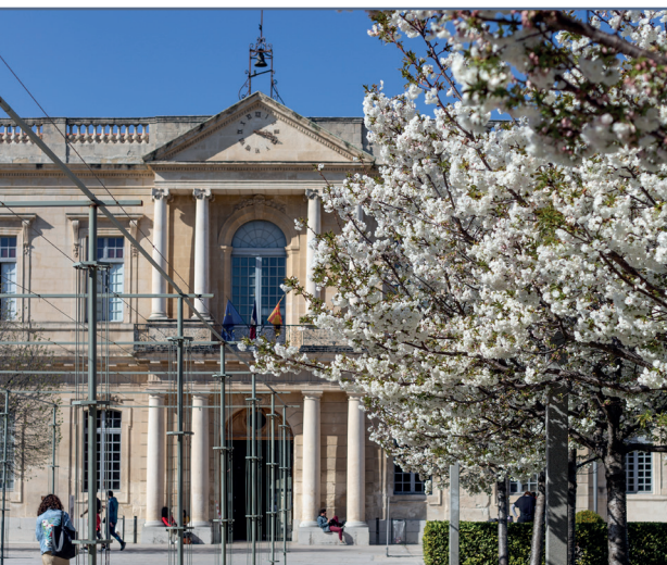
↑ Campus Hannah Arendt, bâtiment Nord

Le campus scientifique et technologique situé à Agroparc et réunissant l'UFR STS et l'IUT est baptisé Jean-Henri Fabre.